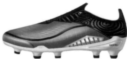
图 5 仰韶文化彩陶元素足球鞋正侧面

平面空间,是指装饰纹样的虚实布局即图案的空间。它和绘画的原理相同,所谓“以虚代实”,“计白当黑”等。不过图案的空间比之绘画更讲求韵律感,更富于装饰美。原始社会庙底陶彩陶的双关图案,就是我国古代图案的空间处理的典范之一。此款足球鞋延续了仰韶文化彩陶纹样,线条复杂,形式多样的特点。笔画稀疏的前帮部分,给人以想象的空间,让人回味无穷。而笔画细致丰富,纹样多变化又有一定规律的后跟与前帮形成对比,达到虚实相生的效果。在装饰上,复杂的图案、标志性的彩陶标识、镜面革装饰出动感而时尚的醒目效果,同时又将美观性与功能性完美的