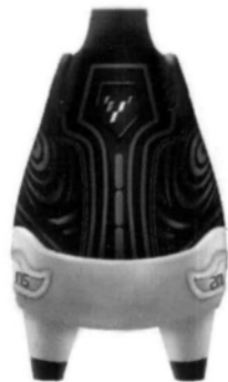
图 6 仰韶文化彩陶元素足球鞋后视图