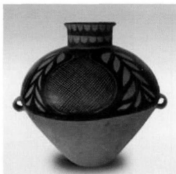
图1 仰韶文化半坡类型彩陶