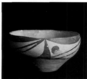
图2 仰韶文化庙底沟类型彩陶

仰韶文化产生于我国新石器时代彩陶最丰盛繁华的时期,距今大约已有七千年左右。仰韶文化的制陶工艺器物规整精美,制陶的工匠能够在器物表面施加各种纹饰,有的装饰主要是为了加固器体,有的则仅仅是为了美观,其中装饰作用最明显的是彩陶花纹。其装饰以彩绘为主,于器物上绘精美彩色花纹,反映当时人们生活的部分内容及艺术创作的聪明才智。早期以红地黑彩或紫彩为多,中期流行先涂绘白色或红色陶衣为地,再加绘黑色、棕色或红色的纹饰,有的黑彩还镶嵌白边。另外还有磨光、拍印、等装饰手法。造型的种类有