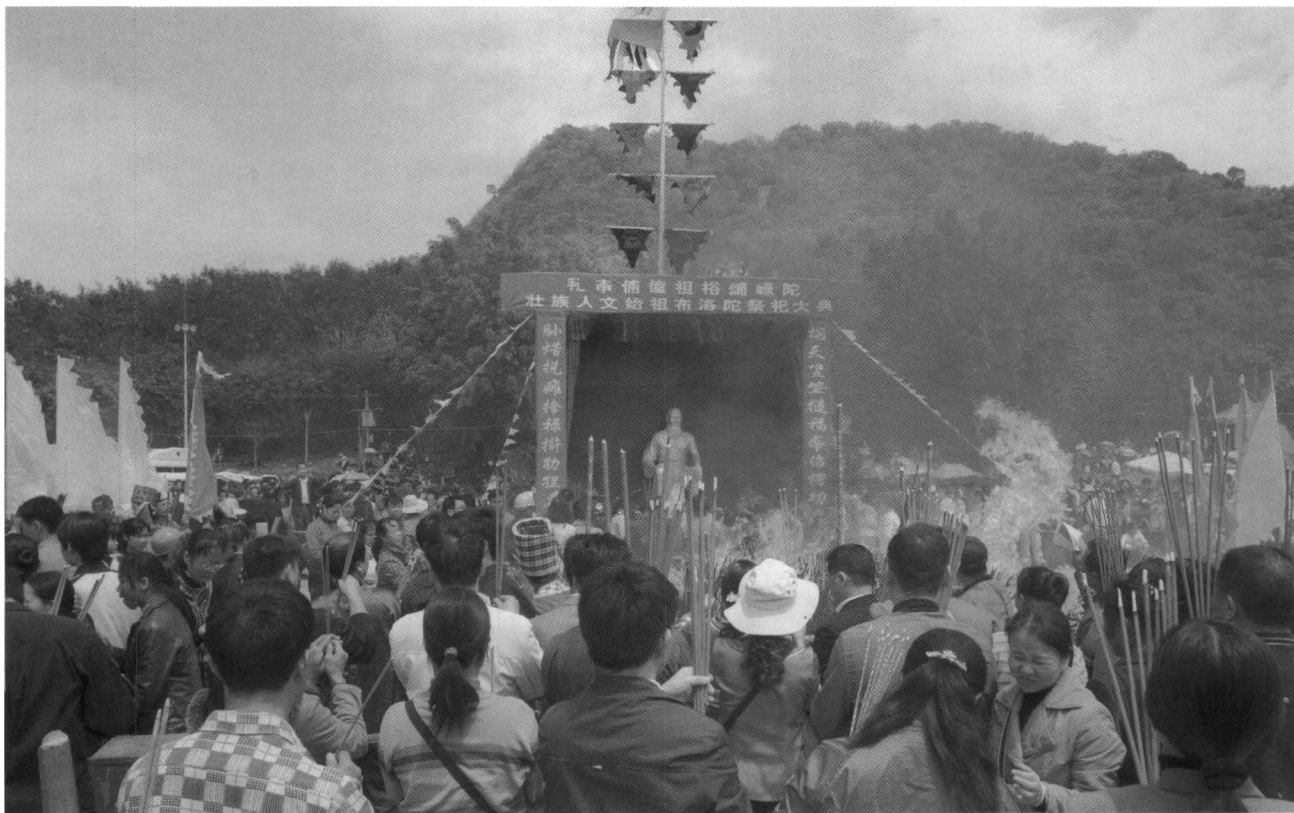
49. 2009年春,广西田阳县敢壮山脚下,民众自发组织祭祀布洛陀,此为上香的人群。

宁等壮族地区,民间至今也流传有不少祭祀布洛陀的活动。如马关县仁和镇阿峨新寨东南面有布洛陀山,山顶上有四棵古椎栗树,其中有一棵树干胸径超过1米、树高约20米的栗树被称为“美洛陀”,即布洛陀神树,当地村民每年都要到山上举行祭祀神树的活动。