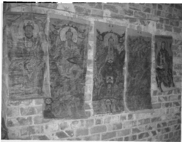
46. 广西田阳县玉凤镇布麽罗汉如收藏的神祇挂像。

(2) 安排世界。为了维护正常的人类社会,布洛陀周到地安排整个世界,协调人与神、人与自然的关系。布洛陀带领众人推高天、撑下地,使人间更为开